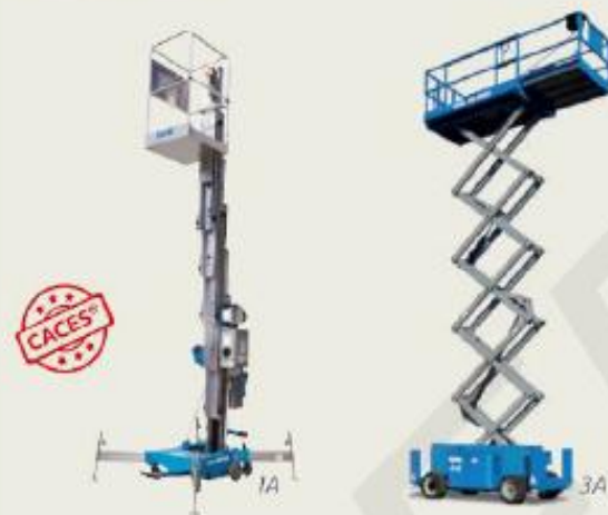
Précédemment catégories 1A et 3A