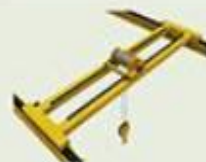
Pont bipoutre posée

Un portique est un appareil de levage à charge suspendue pouvant se déplacer en translation le long de rails ou de chemins de roulement, comportant au minimum une poutre horizontale appuyée sur au moins une palée, et sur laquelle se déplace en direction au moins un mécanisme de levage.