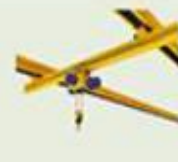
Pont monopoutre suspendue