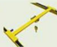
Pont monopoutre posée