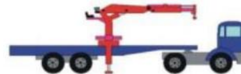
En position intermédiaire