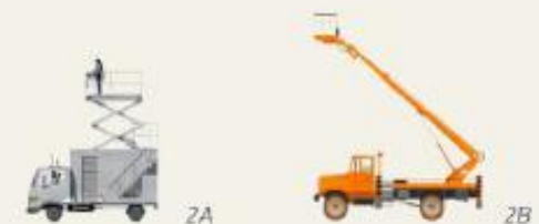
Pas d'équivalence CACES® pour les catégories 2A et 2B. Ces engins nécessitent cependant toujours une